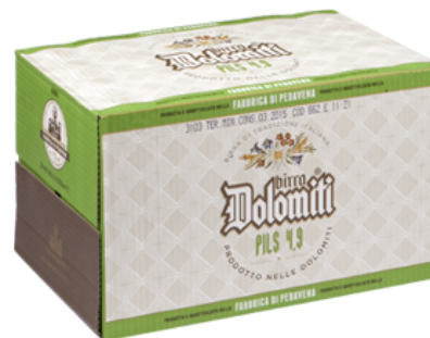
Imballo secondario cartone Codice EAN 8023400106631